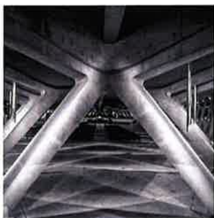
Sanctuaires de Lourdes - D. Banks