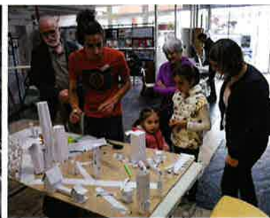
Archicity - Parcours d'Architecture