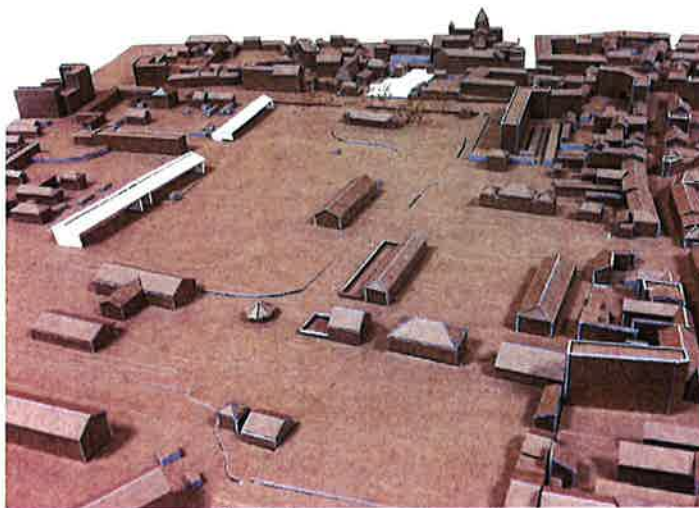
Maquette des Haras - Étudiants de l'école d'architecture de Paris-Belleville