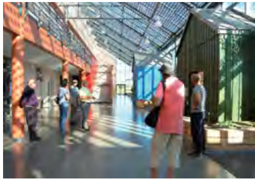
Bordères-sur-Echez, école - Architecte JP Pagnoux

Exposition de projets d'architectes du département des Hautes-Pyrénées qui ont pour objectifs de réduire l'impact négatif du bâtiment sur son environnement et de maîtriser en particulier la consommation d'énergie : choix des techniques, des méthodes de gestion, sélection des matériaux employés et organisation interne des fonctions et des espaces.