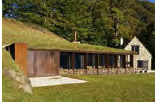
Extension de grange à Lesponne, architectes J. Puig-G. Pujol

Exposition des CAUE d'Occitanie, parcours illustrant l'histoire de l'architecture régionale de 1977 à nos jours. 40 édifices publics et privés, répartis sur les 13 départements qui composent la région ont été sélectionnés.