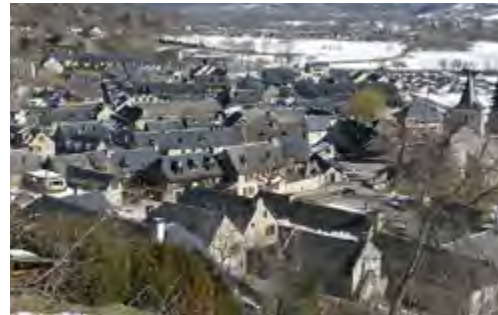
Village de Vignec