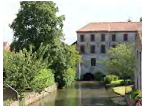
Moulin à Maubourguet