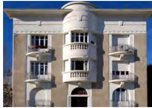
Lourdes, rue des Rochers