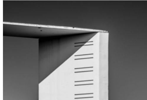
Tarbes, Clinique Ormeau-Pyrénées